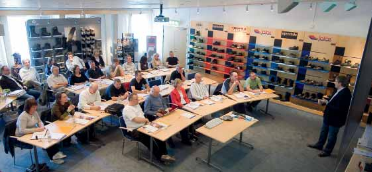
Ejendals gibt seinen Kunden mehr Wissen über Hand- und Fußsicherheit. Auf dem Programm standen u. a. EN-Normen, CE-Kennzeichnung, Ergonomie und Ledertechnik.