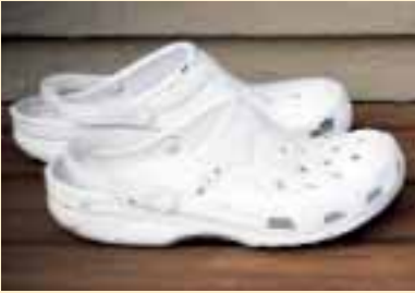
Die ersten Sandalen wurden bereits im Jahre 4000 v. Chr. aus Papyrus, Palmenblättern und Holz gefertigt. Lange vor Crocs...