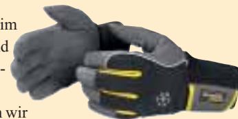
Tegera 9190 mit Handgelenkstütze für Bauarbeiten und Handwerk unter kalten Bedingungen.