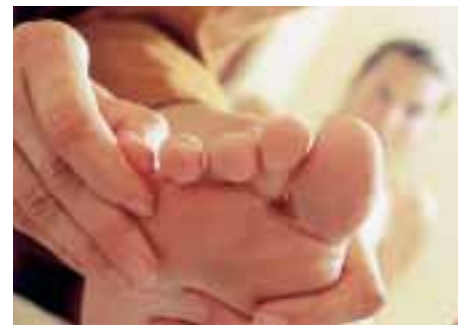
Pflegen Sie Ihre Füße mit einem täglichen Fußbad. Benutzen Sie auch Fußfeile, Nagelschere und Fußcreme.

Feilen Sie vorsichtig an den Fußsohlen, so dass harte Haut entfernt wird. Seien Sie besonders gründlich an der Ferse, an der sich am meisten trockene, abgestorbene Haut bildet. Trocknen Sie die Füße besonders zwischen den Zehen gründlich ab und schneiden Sie die Nägel gerade, denn rundes Abschneiden fördert ein Einwachsen der Nägel. Cremen Sie die Füße gründlich ein. Wechseln Sie täglich die Strümpfe.