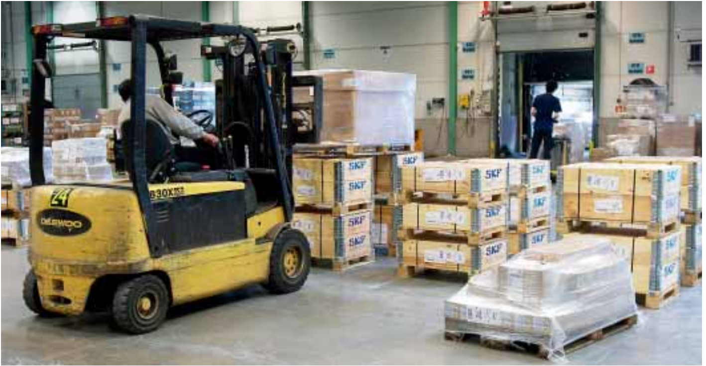
Auf Gabelstaplern werden Güter in hohem Tempo vom Wareneingang zum Warenausgang transportiert. Hier werden auch Güter verpackt, wenn es notwendig ist.