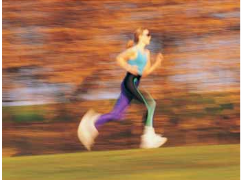
Im Lauf eines Jahre macht man viele Schritte... Richtige Trainingsschuhe sind nach dem Fuß geformt und stützen mit Luftkissen und dicken Sohlen.