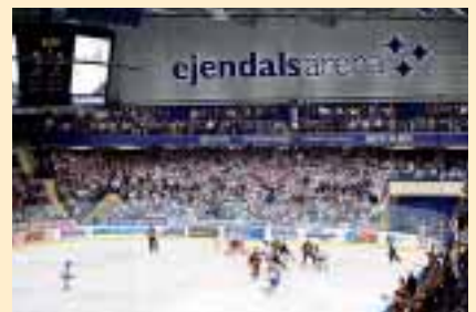
Ed Belfour soll Leksands Verteidigung festigen.

Harte Arbeit mit den Händen verschleißt die Haut, besonders wenn sie empfindlich ist. Daher benötigt sie zusätzlichen Schutz, um geschmeidig zu bleiben – am besten mehrmals am Tag. Pro Solid Handcreme mit Carbamid ist nicht fettig, zieht schnell ein und schützt gegen Austrocknen, aufgesprungene Haut und verletzte Nagelhäutchen. Cremt man seine Hände ein, ist es auch einfacher, Schmutz abzuwaschen.