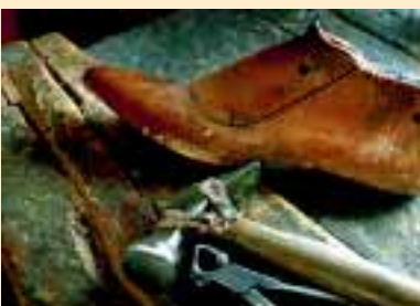
In Schweden wird das Schuhmacherhandwerk zum ersten Mal 1350 im allgemeinen Stadtrecht erwähnt.