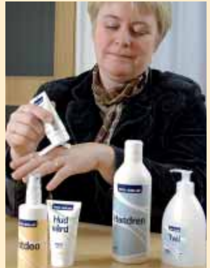
Die Hautpflegeserie Pro Solid pflegt die Haut.