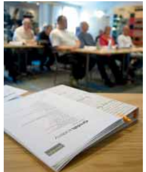
Zum Ende der beiden Kurstage wurde eine Prüfung abgehalten.

– Wir arbeiten mit der Hochschule in Dalarna zusammen, um ein Berechnungsmodell zu erstellen, das konkret zeigt, wie die Zahl der