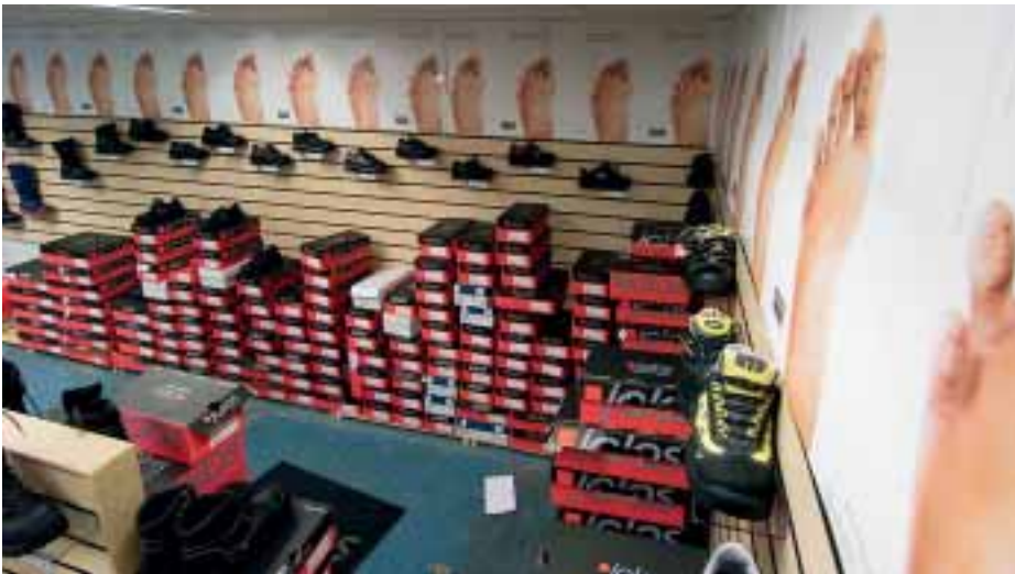
Im zweiten Schub bringt Ejendals sechs Winterschuhe und Stiefel auf den Markt. Im Mittelpunkt steht das Modell J alas 3978 Offroad.