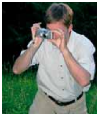
Machen Sie sich ein Bild von Ejendals Schuhen oder Handschuhen.

Schreiben Sie bitte auf den Umschlag oder in die Betreffzeile „Tävlingsbild“ (Wettbewerbsbild). Das Bild muss spätestens am 1. November 2007 bei uns eintreffen. (Einsendungen können leider nicht zurückgeschickt werden.) Viel Glück!