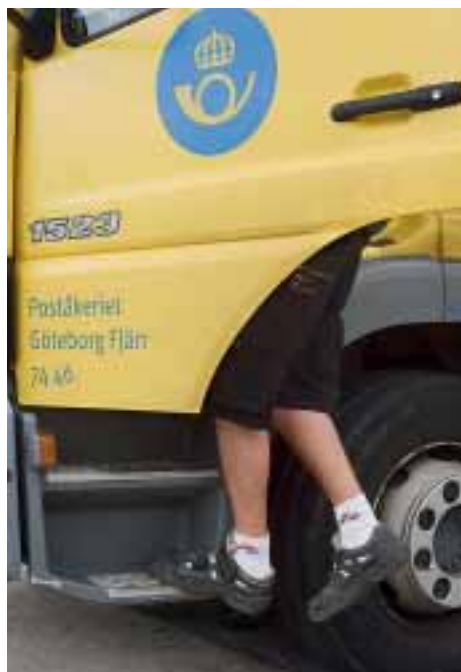
Die Füße stecken in bequemen Sicherheitsschuhen.