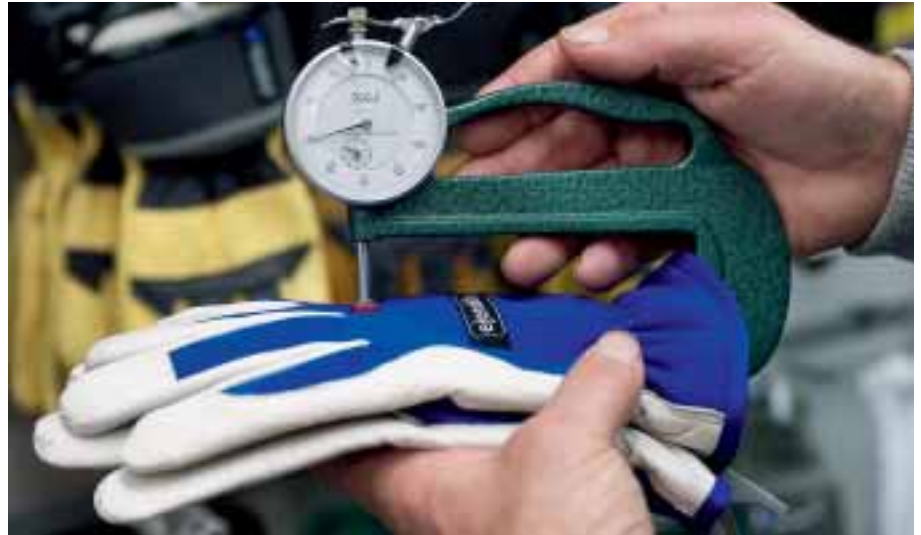
Mit dem neuen Labor kann Ejendal Tests an seinen Produkten selbst durchführen.